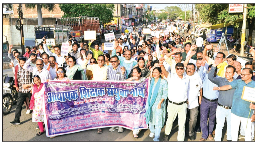
विदिशा। टीईटी परीक्षा के विरोध में ज्ञापन सौंपने के लिए रैली निकालकर प्रदर्शन करते हुए शिक्षक।

अध्यापक शिक्षक संयुक्त मोर्चा मध्यप्रदेश के प्रांतीय आह्वान पर मंगलवार को जिले भर के शिक्षक गांधी प्रतिमा, नोमताल पर एकत्रित हुए और टीईटी परीक्षा के विरोध में सांकेतिक धरना दिया। इसके पश्चात शिक्षकों ने रैली निकालकर कलेक्टर कार्यालय पहुंचकर मुख्यमंत्री मोहन यादव के नाम ज्ञापन सौंपा। ज्ञापन में शिक्षकों ने बताया कि सुप्रीम कोर्ट द्वारा एक प्रकरण के संदर्भ में दिए गए निर्णय के अनुसार वर्ष 2011 के पूर्व नियुक्त