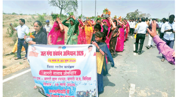
संख्या में जल संरचनाएं विकसित की जा रही हैं। इन कार्यों से न केवल भू-जल स्तर में सुधार की उम्मीद है,